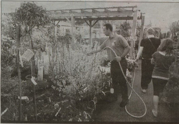
Les jardinerie connaissent un regain de fréquentation depuis 10 jours

Mars, est aussi la bonne période pour les semis. Dans les potagers – en vogue en ce moment avec la mode du faire soi-même – c'est le moment de semer des pommes de terre, des salades et même des tomates sous abri. Un bon moyen de faire des économies tout en se distrayant.